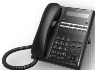
โทรศัพท์ดิจิทัลรุ่น 12 ปุ่ม