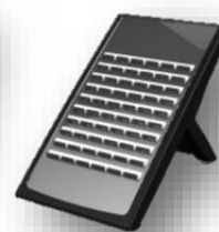
DSS คอนโซล 60 ปุ่ม