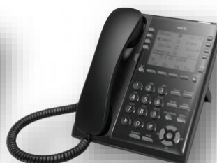
โทรศัพท์ IP รุ่น 8 ปุ่ม